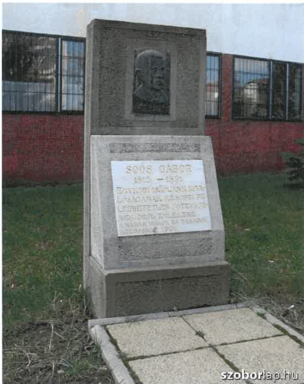
Soós Gábor emlékoszlop a hajdúnánási Béke-parkban