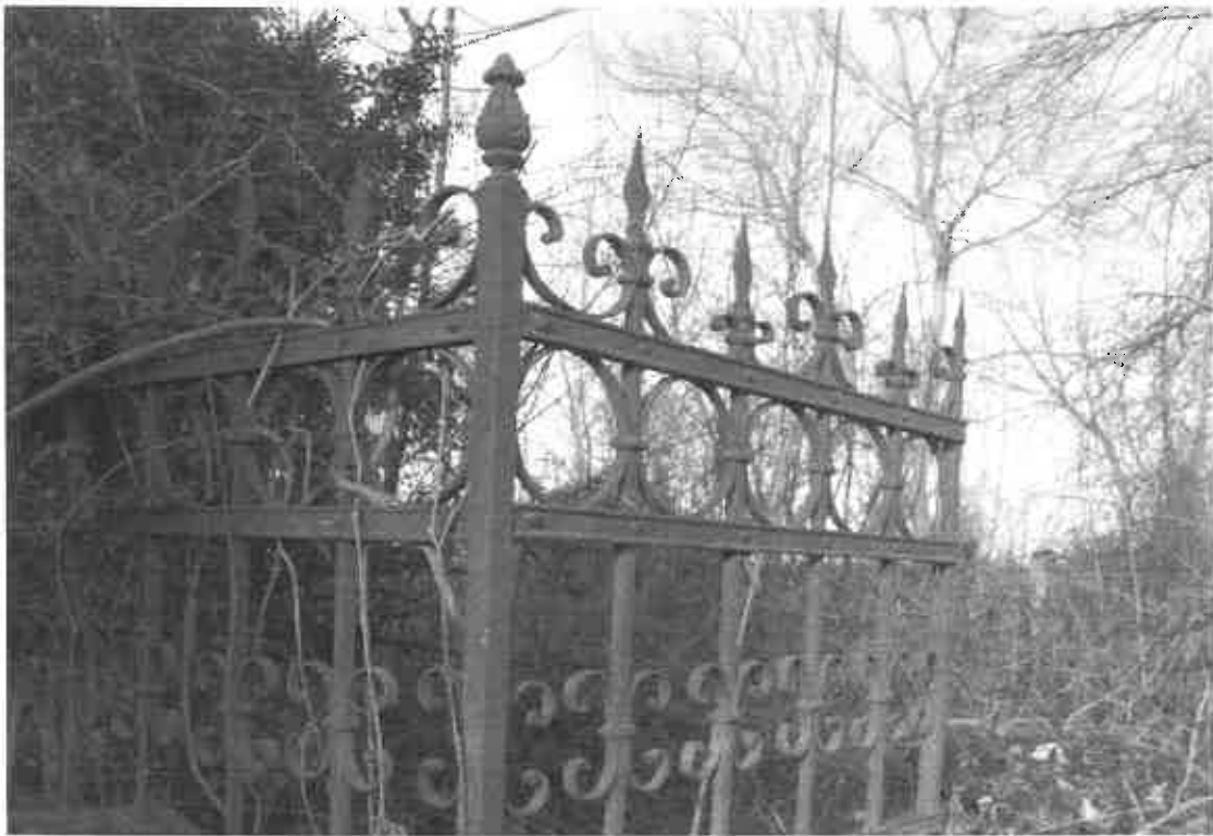
Sírkerítések a Régi Felső Temetőből