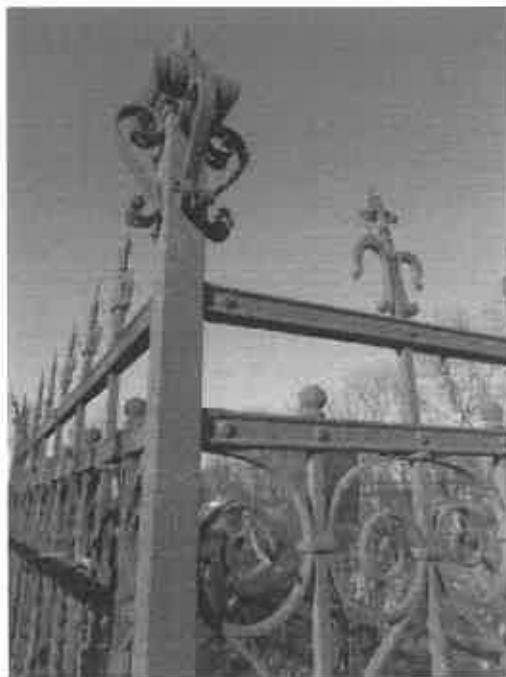
Spirál-, és vasöntvényes oszlopfők a Régi Felső Temetőben (2016)