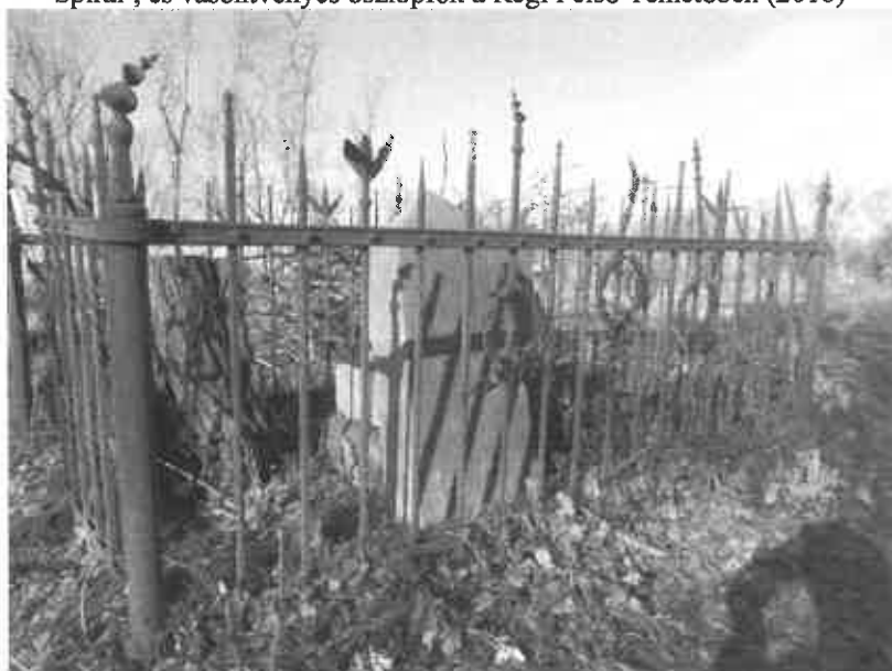
Babérlevéldíszek és babérkoszorúk csigás oszlopfővel Lent csillagdíszes pálcavégek (Régi Felső Temető, 2016)